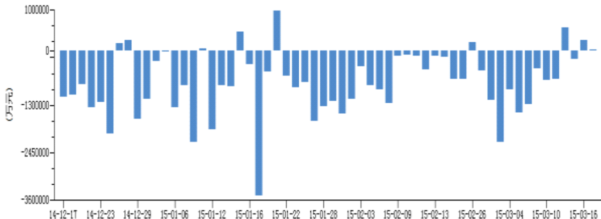
图3 沪深300指数资金流向